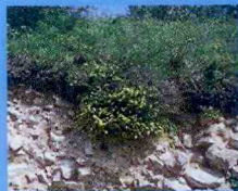
Buisson de genista